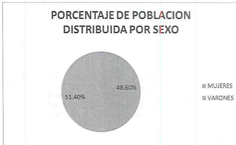
GRAFICO 1: POBLACIÓN POR SEXO